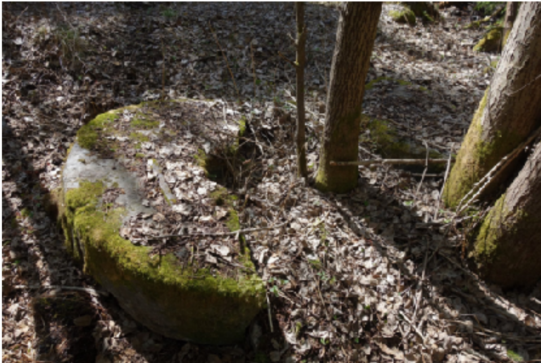
Här hittar man även en stor kvarnsten som numera gått i två delar